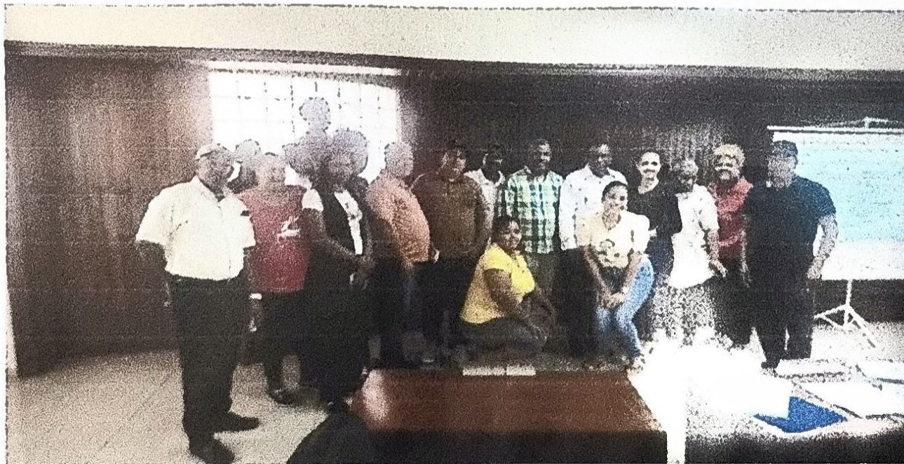
Foto de la actividad: Presentación de las rendiciones de cuentas sobre proyectos del PMD ejecutados con el Presupuesto Municipal.”